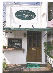
(山陽電車 月見山駅改札口出すぐ)